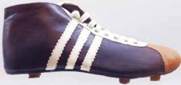
WM 1950 Entscheidungstor für Uruguay von Alcides Ghiggia.